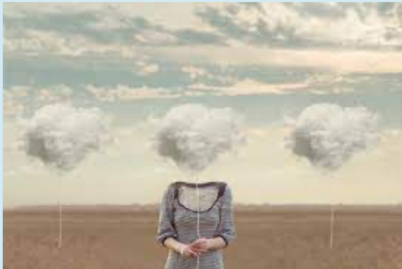
(Broze Wolken, z.d.)

Bij moederschap komt veel meer kijken dan enkel mama worden. Het is een overgangperiode waarin je als mama de balans probeert te zoeken tussen “zorgen voor”, “verschillende rollen vervullen”, “zelfzorg”, “herstellen van de bevalling” en zoveel meer. Dit loopt niet altijd vlekkeloos en kan veel gevoelens van onzekerheid, schaamte en schuld oproepen. Het is een periode waarin je je soms eenzaam of onbegrepen kan voelen en waar je omgeving soms niets van opmerkt. In deze periode, waar vaak gedacht wordt dat je op een roze wolk moet zitten, kan het zijn dat dit meer als een broze wolk aanvoelt.